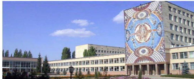
Кропивницький – 2025 Kropyvnytskyi – 2025

Thesis XIII th International Scientific and Practical Conference December 3, 2025